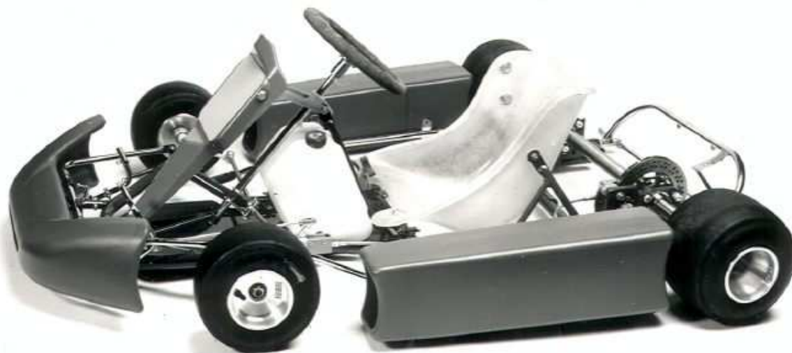
Photo du châssis avec pneumatique